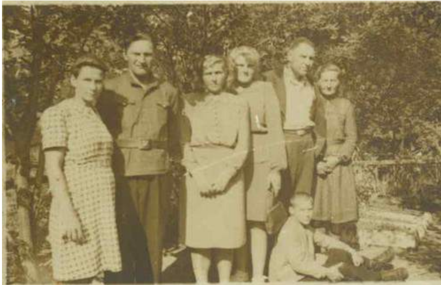
Hänike küla elanikud olid seotud peamiselt Osula Prassimäe kalmistuga. Fotol omased Lustivere talust lahkunute hauaplatsidel

Kirikuarhiivist leiame veel materjale küla inimeste koguduse liikmeteks olemise kohta, osavõttust koguduse tööst, armulaua käimistest ja palju muud. Kõik see räägib palju inimese vaimse ja selle arengu kohta.