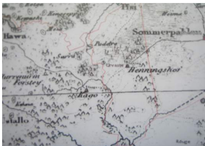
Kaardil on märgitud Henningshof, so Kärgele karjamõis

Eraldi peab aga käsitlema suusõnaliselt kogutud materjale, mis alati pole saadud otseselt algallikalt, teejuhilt, vaid kaudselt, küsiteldava isiku ümberjutustamise kaudu, kusjuures algallikaks on hoopis ammu lahkunud inimene. Paraku elame kiirenevate muutuste aegadel, mistõttu inimesed muudavad sageli oma elukohta, kuid iga kolimisega läheb kaduma hulk väärtuslikku koduloo alast materjali. Peame sellega leppima, et alati pole võimalik esitada kirjapanduid allikaid ja leppima hoopis küsiteldava mälus talletatuga.