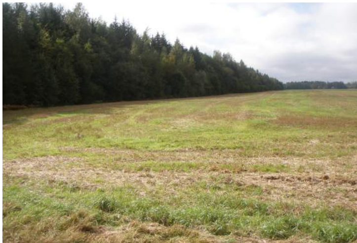
Hänike küla Tagametsa maad (praeguseks kadunud taluasemetega)

Kärgula mõisapiirkonna Hänike küla Tagametsa maadel asus 19.sajandi keskpaiku renditalu, mille omanikke tunti kui vargaid ja röövleid. Kohalikud vanemad inimesed teadsid rääkida, et varaste poolt oli kokku aetud kõiksugu vara, sealhulgas kuldesemeid, -raha, münte, mis on kaevatud, peidetud renditalu lähistelega maa alla.