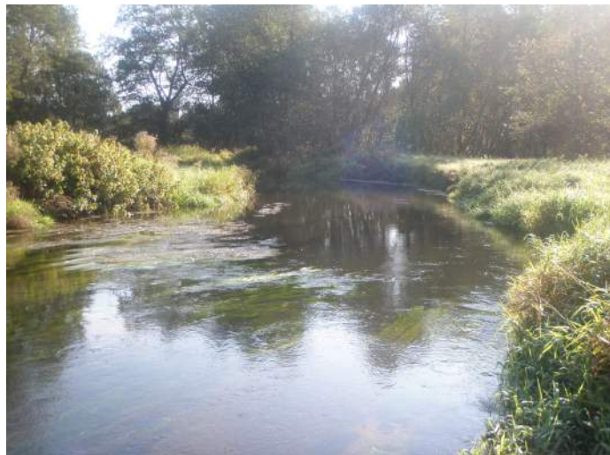
Pühajõgi Osula Harjumäel

Meist maha jääb mure - igavik sinitaevas. Usk, lootus – ei sure, ehkki hing veel vaevas.