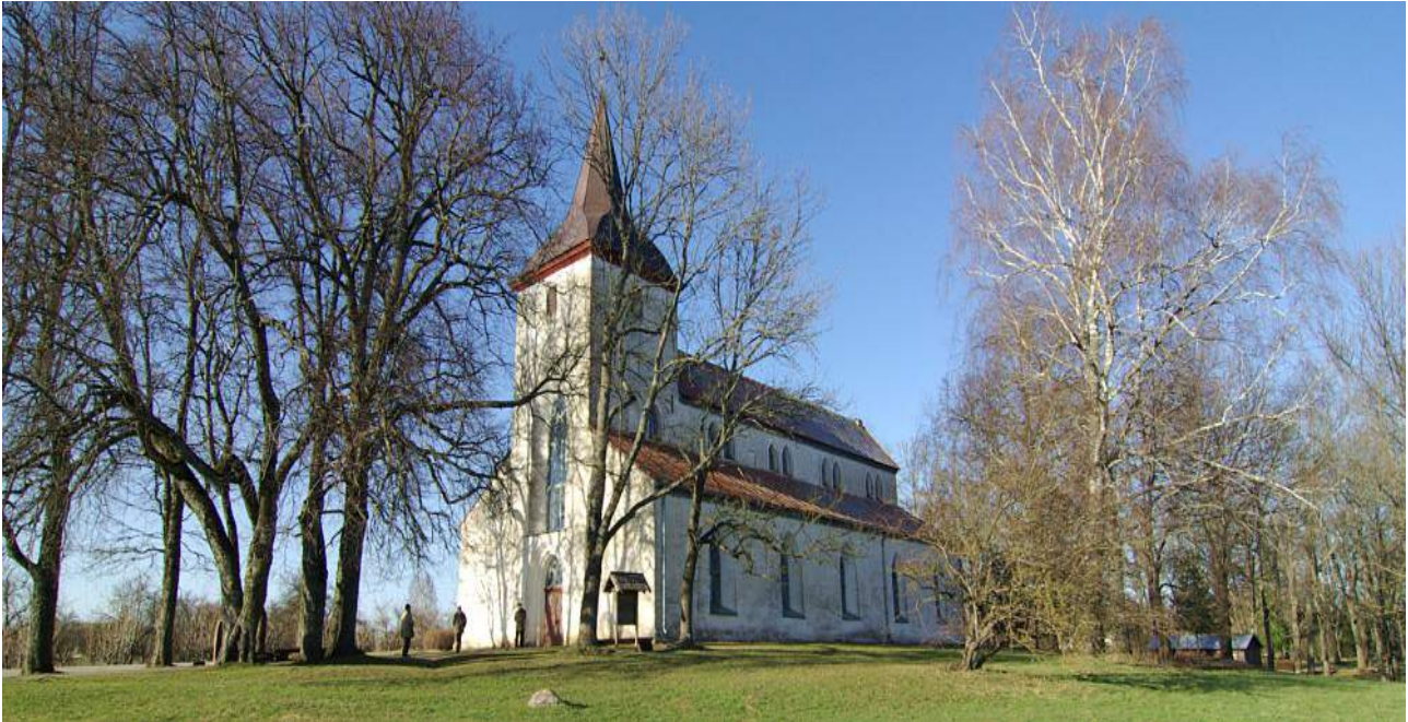
Urvaste Püha Urbanuse kirik