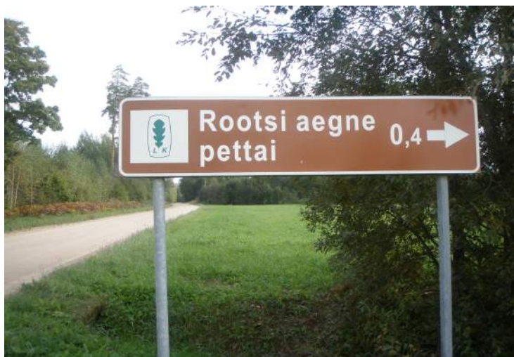
Teeviit Hännike-Sõmerpalu maanteel, mis osutab Vilbusoo suunas

Teati rääkida, et Vilbusoos otsisid varjupaika mõned Rootsi väejooksikud, kuid kelle venelased üles leidsid ja julmalt tapsid „nii et maharaiutud peadega laipadest verd purskas üles joana“. Juttude kohaselt praegugi võib soos leida pruunika veega allikaid, millest heinalised mitte kunagi ei joonud. Mõned heinalised olid isegi näinud allika põhjas tapetud Rootsi sõjameeste nägusid.