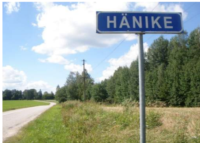
Hänike küla maastik on mitmekesine, kuid hõreda asustusega

Kirjalike andmete kohaselt oli Hänike küla ( Hennige, Henninge, Henningshof ) veel 1638ndal aastal inimtühi ( Hennige Metz Pustus ). Katkust, sõdadest ja näljast tekkinud „tühjus oli nii masendav, et inimene, kes leidis teise inimese jalajälje, lausa nuttis“. Inimtühjust meenutavad praegugi mõned kohanimed, näiteks Võsumäe, Kannistiku jt. Hiljem sai Hänike tuntuks ennekõike Kärgula karjamõisana, mille asustatus aegamööda, kuid pidevalt kasvas. Huvipakkuv on ehk seik, et Häniket seondatakse ennekõike Sõmerpaluga, ehkki palju pikemat aega oli ta seotud Kärgulaga. Suurim asustustihedus saavutati siin alles 19.sajandi teisel poolel, so talude päriksostmise aegadel. 20. viimasel veerandil aga küla elanikkond vähenes järsult, mille tingis maatööde ulatuslik mehhaniseerimine ja vaba tööjõu teke, kes otsisid rakendust linnades. Küll aga veel 1970 aastal elas Hänike külas üle saja elaniku, praegu vaid mõnikümmend.