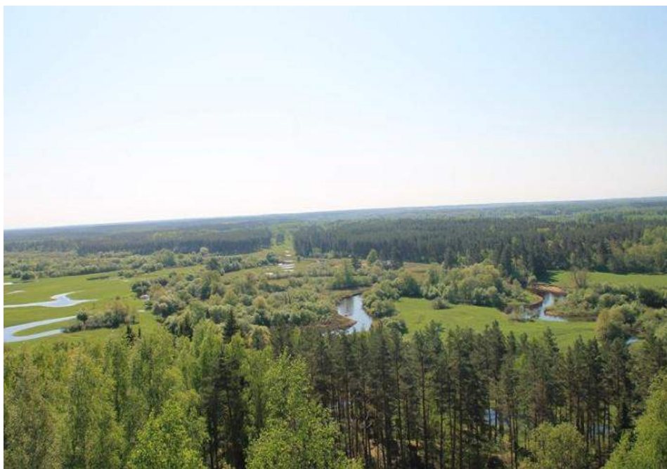
Mustjõgi lookleb läbi Kerreti soo

Ütskõrd ma tõuse siit mädäsuust, vii üten kõik kaonu hinge. Kaos Keretü kurjapuust, aig tege uusi ringe.