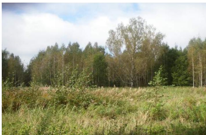
Hänike küla Turna taluase tänapäeval (2014)

Oli ka Meelal kannatusi. Kord tormanud oma ratsul koos saatjaskonnaga Kärgula mõisnik tuhatnelja Kerreti jahimaadele. Tema teele jäänud ette, aokubu seljas, eideke Meela, kelle peale mõisnik olla väga vihastunud ning härra äianud piitsaga üle eidekese näo. Meela vaid lausunud: lööd küll mind, kuid armid-haavad saab sinu tütreke. Mõisniku vihahoog oli piiritu ja ta virutanud veelkord eidekesele. Õhtul koju jõudes oli mõisniku imestus piiritu, kui nägi tütrekese nägu armides, mille ta langes masendusse.