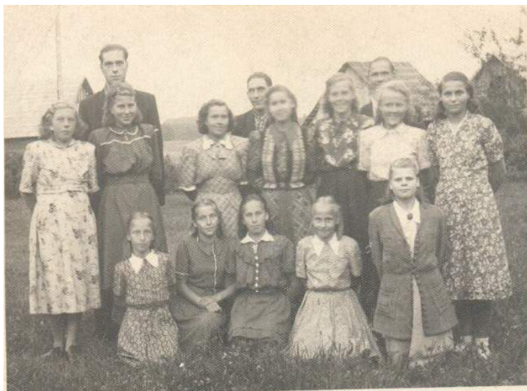
Hänike küla noored 1950ndate algul