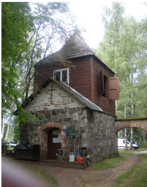
Osula Prassimäe kalmistu kellatorn