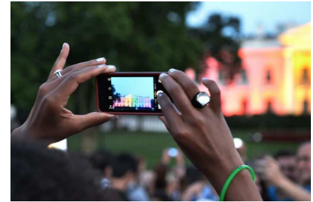
Uue reaalsuse aken: vikerkaarevärvides Valge Maja 26. juunil 2015.