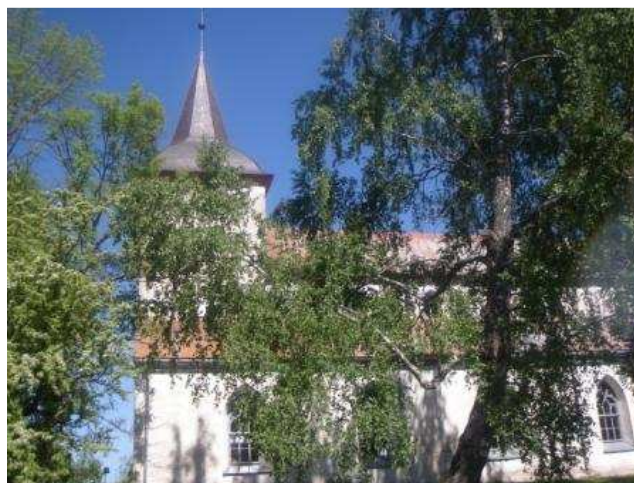
Urvaste kirik. Lustivere Raudseppade kodukirik.