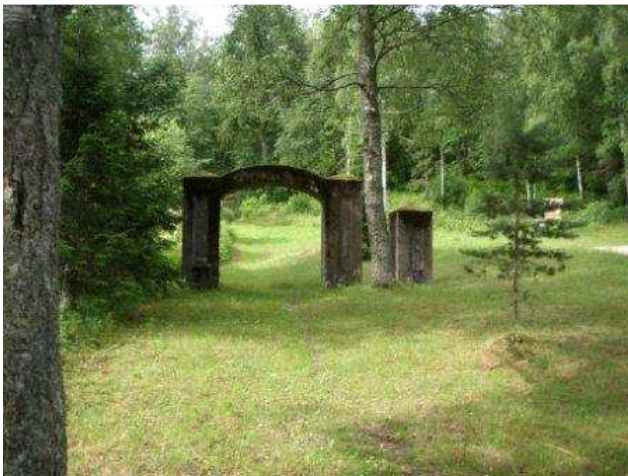
Osula Prassimäe kalmistu värav.