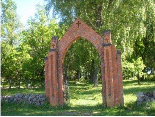
Sangaste kalmistu, kus asuvad Raudseppade hauaplatsid.