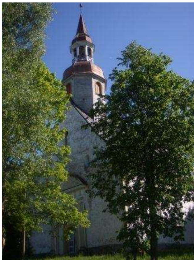
Sangaste kirik. Raudseppade kodukirik (ristsed, leerid ja laulatused).