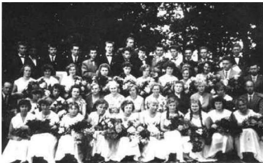
Antsla Keskkooli 12. lennu lõpetajad (1960)

Kui Eestis 1990ndate alguses räägiti irooniliselt nn konnatiigist, verepilastamisest jms, siis kui valus seda ka kuulata polnud, oli see siiski väga tõsine jutt. Tõdeme, et ühe noore inimese tee maailma saab olla vaid läbi suurte keelte ja osasaamises suurrahvaste vaimuvarast. Vähemalt mulle oli selge üks: et leida vaimset rahuldust, tuleb teha väga palju iseseisvat tööd, sh eriti keelte alal.