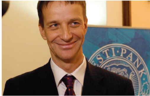
Majandusdoktor Ardo Hansson, Eesti Panga president aastast 2012

Uue põlvkonna majandusteadlasi tuli Eestisse ka väliseestlaste seast. Üheks väljapaistvamaks maailmatasemega majandusteadlaseks on Ardo Hansson (1958), Eesti Panga president, kes kaitses majandusdoktori kraadi Harvardi Ülikoolis.