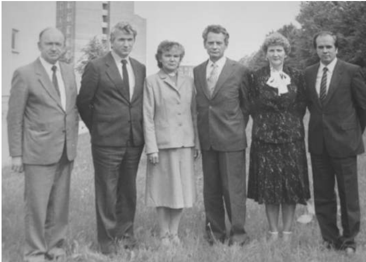
TÜ majandusteaduskonna kateedrijuhatajad (1980ndad)

Eestis aga toimusid nendel aastatel väga järsud muutused, sh eriti Tartu Ülikoolis.