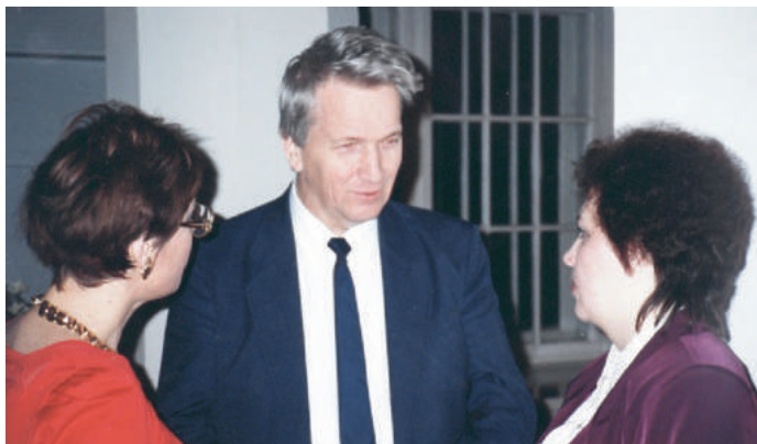
Endiste kraaditaotlejate, nüüd juba majanduskandidaatide keskel