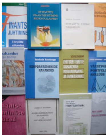
Rahandusalaseid väljaandeid aastast 1974–1994

Vanema põlvkonna lahkumist ja uue tulekut on hea vaadata seoses TÜ majandusteaduskonna õppehoonete muutumisega, s.t lahkumisega endisest ja kolimisega uude. Kui asusin tööle äsja just isesisvunud teaduskonda 1. septembril 1968, asus teaduskond Vanemuise tänava majas nr 46. Ruumikitsikus oli kohutav, sest auditoriumid asusid hoone keldrikorrusel ja kateedrite ruumid olid nii pisikesed, et igale õppejõule ei jätkunud isegi töölauda. Küll aga 1977. aasta algul kolisime juba uude õppehoonesse, mis asus Nooruse tänaval. Maja oli koolihoone tüüpprojekti järgi ehitatud, mitte just kvaliteetselt (nt talvel oli soojapidavus nigel, auditoriumid ebameeldivalt külmad jms) ning õppehoonet pidime paraku jagama Tartu Meditsiinikooliga. 1999. aasta alguses valmis Economicumi hoone juba kõigi mugavustega. Juhtivpersonal sai eraldi tööruumid, õppejõudude tööruumide laudadele ilmusid arvutid, raamatukogu sai korraliku ruumi jms. Tõusis õppejõudude endi kvalifikatsioon, kompetentsus. Sõnaga, kõik liikus paremuse, modernsema suunas, mistõttu võisime rääkida juba maailmas tunnustatud õppe-teadustöö tasemest.