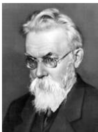
Akadeemik Vladimir Vernadski

Teisalt on aga inimese tarkus, mis on kättesaadavaks tehtud ka teistele kõikvõimalike teabekanalite, sh raamatukogude vms kaudu. Inimese tarkus ja mõtlemine on materiaalsel, ainelisel alusel, kuid kui siia lisandub intuitsioon, selgeltnägemine vms, siis see on Looja ilmutus. Küsimuseks jääb aga see, miks ja kui palju inimesele on antud osa saada Looja tarkusest (tänapäevaks ja tulevikus)? Ja kui palju jagatakse seda tarkust veel tulevikus?