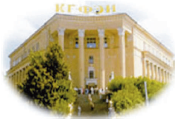
Kaasani Finantsmajanduse Instituut (1980)

Teadustöö pakkus rahuldust, andis vabaduse mõelda, reisida, suhelda kolleegidega, ehkki paraku väga rangetes piirides, ennekõike vaid NSV Liidu avarustes. Need olid parimad loomeaastad, mis avatud maailma puhul oleks kindlasti leidnud hoopis võimsama väljundi. Aga selline oli meie aeg ja meie võimalused.