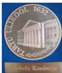
Tartu Ülikooli suur medal

Olen tänulik, et Tartu Ülikool tunnustas vääriliselt minu aastakümneid kestnud õppe- ja teadustööd. Samad tänusõnad Tartu linnale, kes väärtustas minu elutööd Tartu medaliga.