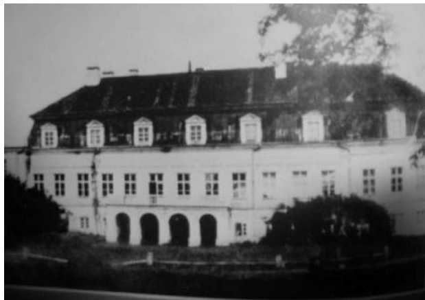
Kärjala mõis 19. sajandil