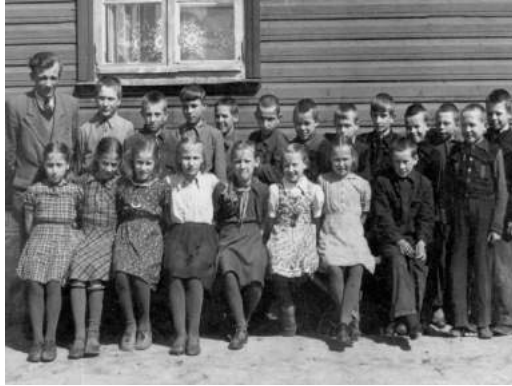
Kurenurme kooli 4. klassi õpilased koos klassijuhatajaga (1953. a)

hulgi traumeeritud lapsi – ülekohtune nähtus, mida tänapäeva arusaamade kohaselt on väga raske seletada.