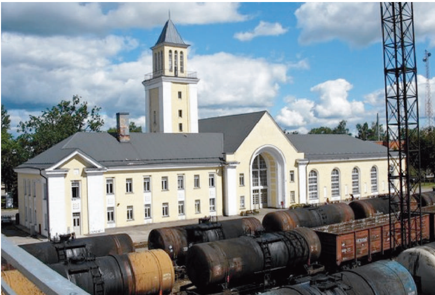
Valga raudteejaam, mis toimis 1960ndal migratsioonipumbana

Üks väike kõrvalepõige. Nimelt 1950. aastate lõpus oli Eestis elavate maainimeste seas suhteliselt suur tööpuudus, teisisõnu, maal oli palju vaba tööjõudu, kes ei leidnud aastaringset rakendust. Algas inimeste äravool linnadesse, kus neil oli samuti raske rakendust leida. Nimelt tegi tol ajal Eesi NSV valitsus väga õige otsuse, et hakkas rajama ettevõtteid ja nende filiaale kõikvõimalikesse asustatud punktidesse. Nii sai Valga endale õmblusvabriku, Võru – gaasianalüsaatorite tehase jne, kuid sellele lisandus veel mitmeid ehitusettevõtteid, metsakobinaate, mööblivabrikuid jmt. Sel moel sai vaba tööjõud nii ulatuslikult rakendatud, et tuli värvata tööjõudu veel lisaks isegi teistest liiduvabariikidest. Näiteks, Valga ettevõtetes töötas nendel aastatel üsna arvukalt lätlasi ja venelasi, eriti Pihkva oblastist, ning teiste rahvuste esinajaid mujalt meie nn suurelt kodumaalt. Niimoodi sattusin ka mina sellesse 1960ndate järskude muutuste karusselli.