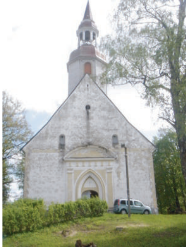
Sangaste kirik (taastatud 1742. a)