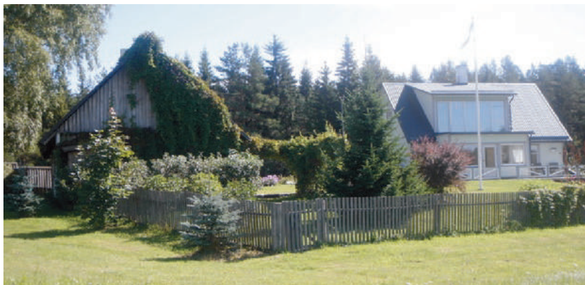
Järve talu Koorastes (2012)

Maakodu oma avaruse, privaatsuse ja looduslähedusega on ihaldusväärseks paigaks igale eestlasele, seda eriti pensionieas. On aega mõtlemiseks, meenutusteks ja üldistuste tegemiseks sündmuste üle, mis minuealistel kõigil veel hästi meeles. Erinevate inimeste hinnangud olnu ja tolle aja inimeste kohta aga erinevad kardinaalselt.