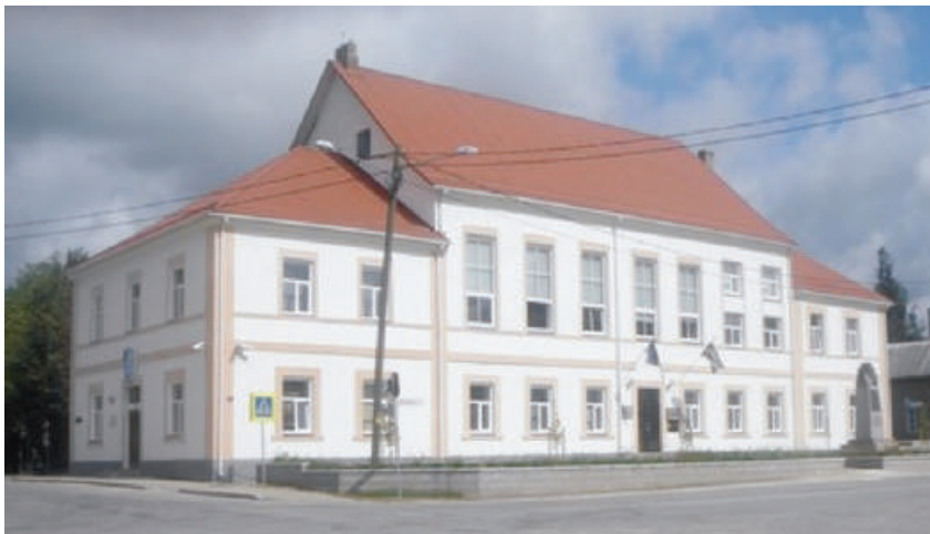
Antsla keskkooli õppehoone 1950ndatel