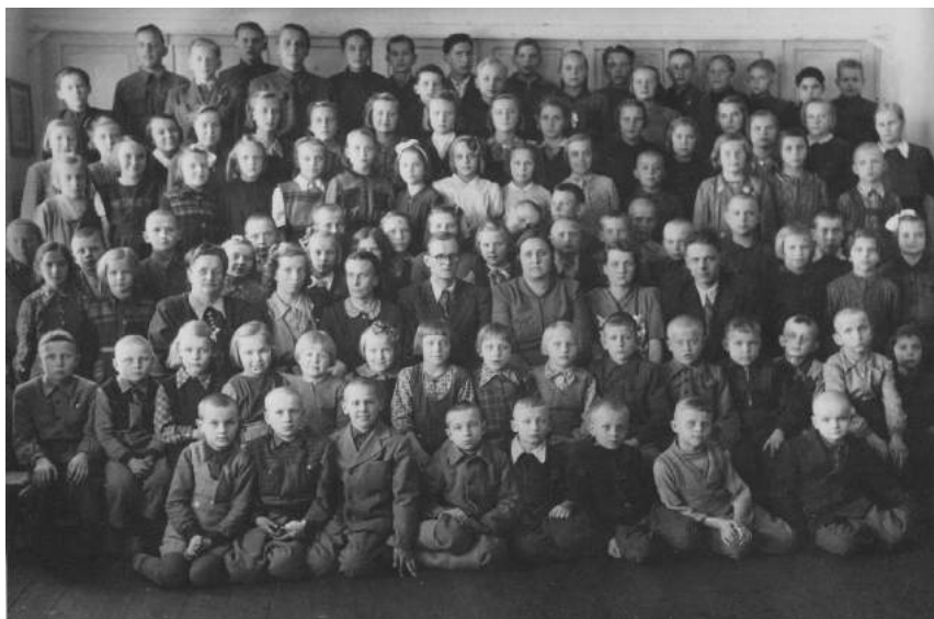
Kurenurme kooli õpilased ja õpetajad 1949. aastal