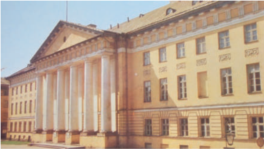
Tartu Ülikooli peahoone

olid väarikad ennekõike sellepärast, et nad tänu oma eriharidusele ja erialalistele oskustele väärised oma ametikohta, mitte aga polnud juhuslikud tõusikud, kompartei poolt väljavalitud ja suunatud inimesed. Viimaseid oli pärast sõja-aastatel oi kui palju ja võttis aastaid, enne kui nendest kompartei soosikutest vabaneti.