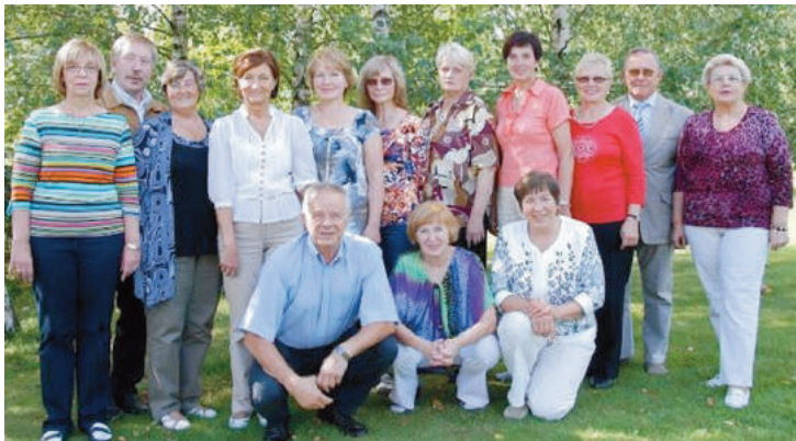
1968. a Tartu Ülikooli rahanduse erialale sisseastujad 2013. a