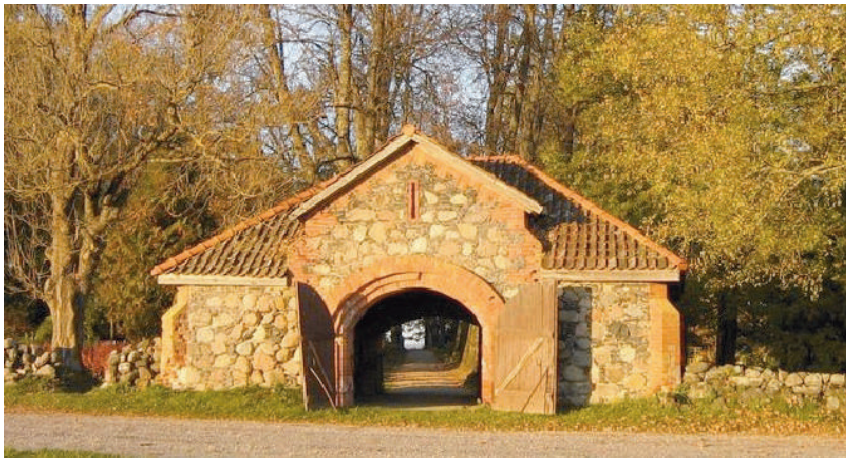
Sangaste kalmistu värav