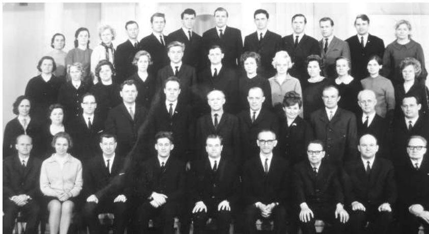
TÜ majandusteaduskonna õppejõud ja abipersonal (1968)

Tolle aja TÜ majandusteaduskonna õppejõud paistsid silma kollegiaalse ja heasoovliku suhtumisega, mistõttu ma ei mäleta ka ühtegi tõsist konflikti. Võrreldes majanduspraktikas, ehitusettevõttes toimuvaga oli see kõik nagu öö ja päev. Muidugi abipersonali, sekretäride osas olid asjad nii ja naa. Eks nõukaajal oli koristaja rektori järel tähtsuselt teine isik!