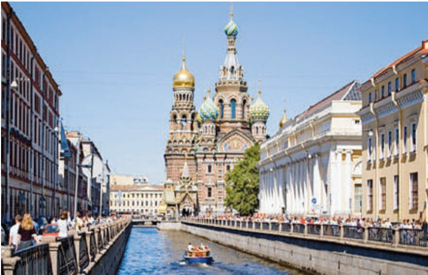
St Peterburgi Gribojedovi kanal, mille ääres asub Majanduse ja Rahanduse Ülikool

esinemistest rahvusvahelistel teaduskonverentsidel. Kuna need olid vaid erandid ja üldjuhul valiti kohtadele vaid kõrge kvalifikatsiooniga inimesi, siis tunti 1980. aastatel Tartu Ülikooli kui üht NSV Liidu juhtivat ülikooli. Et saavutatut taset kindlustada, siis vähemalt meie ülikooli rektoraadil oli seisukoht, et uusi noori teadusdoktooreid peab jätkuvalt juurde tulema.