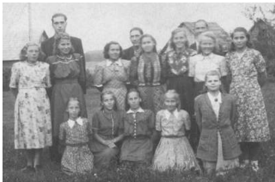
Hänike noored 1950ndatel

jõudnud. Koer võttis õrnalt kanapoja hammaste vahele ja viis ikka ja jälle teistele järele. Ja vaat imet, tibuke kasvas ja sirgus tugevaks kanaks.