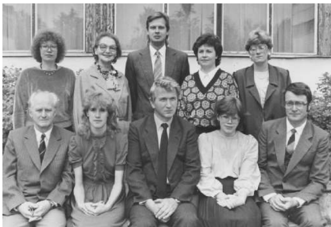
Rahanduse ja krediidi kateeder (1980ndatel)