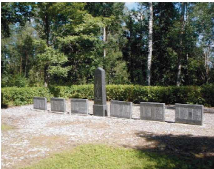
Teises maailmasõjas langenute mälestussammas Osula kalmistul

Meenutuseks üks hetk möödanicust seoses ilmasõjas langenud mälestussambaga. Ise kohtasin-nägin Vene sõdurit esimest korda 1944. aasta hilissuvel Hänike külas, oma koduõuel. Nad olid väga noored, lausa poisikeseohtu, alatoidetud, kõhnad ja kurnatud, kuid samas kõhedust tekitavad. Eks ohvriterohked, ränkrasked sõja esimesed aastad olid oma laastava töö teinud, nii et enamik vanema põlvkonna, kogemustega sõjameestest olid langenud ning nende asemele olid mobiliseeritud verivärsked noored. Lahingukogemuste puudumise, aga ka kõrgema juhtkonna hoolimatusega on samuti seletatav langenute ebaloomulikult suur arv.