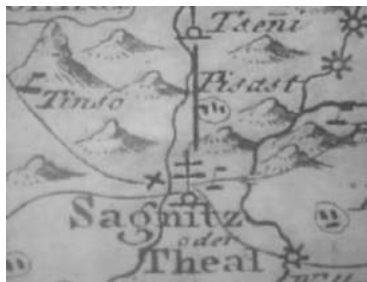
Väljavõte Sangaste ajaloolisest kaardist, millelt leiame Piisaste küla

Piisaste küla tänapäeva kaartidelt me ei leia, kuid 1600. aastatel oli ta olemas nii kirikuraamatutes, kui ka käsitsi visandatud kaartidel. Niisiis, Sangastest (Sagnitz) mõni kilomeeter põhja suunas asub Piisaste (Pisast) küla.