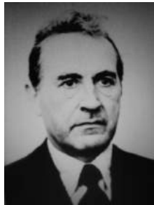
Rahandusminister Endel Mändmaa (1980ndatel)

Pärast seda, kui olin lõpetanud TPI majandusteaduskonna, tekkisid mul kohe mitmed väga meeldivad sidemed selle teaduskonna lõpetanud vilistlastega. Eraldi tahan esile tõsta koostööd tolle aja rahandusministeeriumi töötaja Endel Mändmaaga (1928–2006). Pärast TPI majandusteaduskonna lõpetamist (1952) töötas ta rahandusministeeriumis mitmesugustel ametikohtadel, kuni tõusis ministriks aastatel 1979–1990. Ta oli korduvalt TÜ rahanduse eriala lõpueksamite komisjoni esimeheks. Ministrina Endel Mändmaa retsenseeris mitmeid minu teadusuuringuid, sh doktoriväitekirja. Inimesena oli ta alati täpne, sõnapidaja, heasoovlik ja oma eriala sügavuti tundev kolleeg.